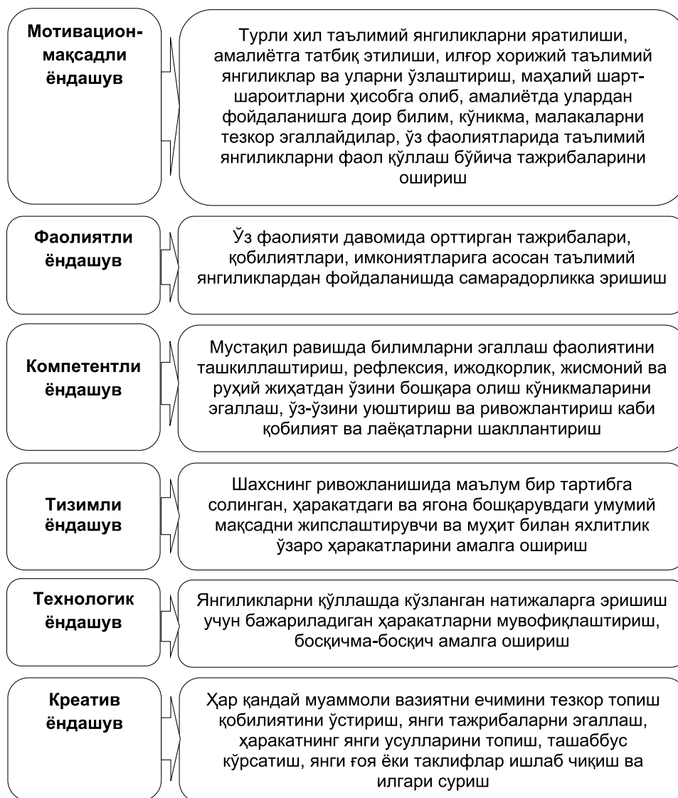
3-расм. Инновацион ёндашувлар таркибий компонентлари.

циялар шахсий сифат сифатида интеллектуал мослашувчанлик, ижодкорлик, янги мурожаат қилиш истагининг passiонарлиги билан боғлиқ.