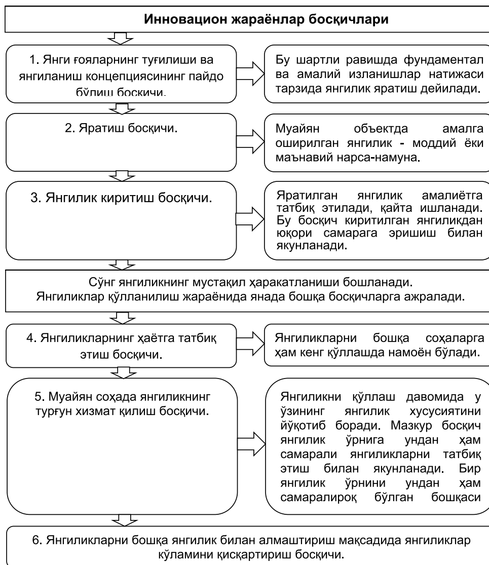
1-расм. Инновацион жараёнлар босқичлари.

шишнинг гаровидир. Шу сабабли инсонни замонавий, жадал ўзгарувчан дунёда тарбиялай оладиган педагогнинг малакали, ижодий фикрлайдиган, рақобатбардош шахсига бўлган талаб кескин ошди» (1-расм 1 ).